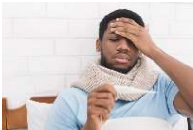
Fiebre de 100.4° o más